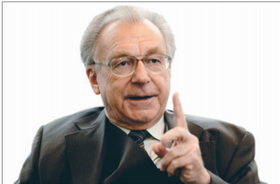
... gilt ebenso als typischer Baden-Württemberger wie sein Vorgänger Lothar Späth ...