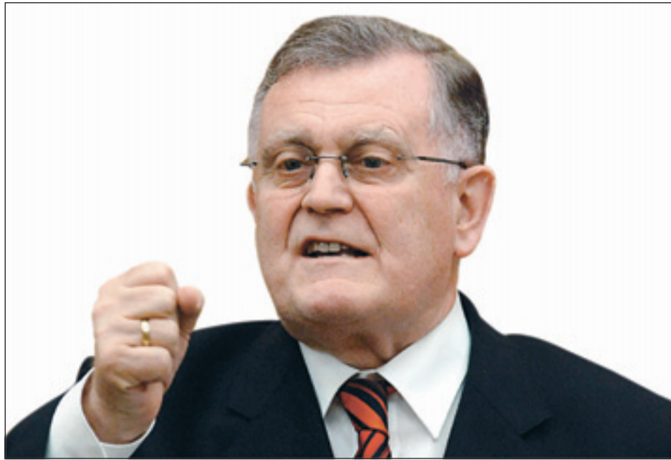
Als Werbeträger fürs Land empfohlen: Exministerpräsident Erwin Teufel ...

Beim Baden im Bodensee ist gestern in Konstanz ein 14-jähriges Mädchen ertrunken. Laut Polizei war die Schülerin zusammen mit ihrer älteren Schwester in der Nähe des Yachthafens schwimmen gegangen. In rund 30 Meter Entfernung vom Ufer ging die 14-Jährige plötzlich unter. Die Wassertiefe beträgt an der Stelle etwa 2,50 Meter.