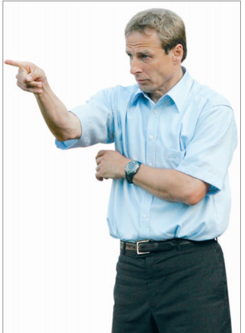
... oder Fußball-Nationaltrainer Jürgen Klinsmann.